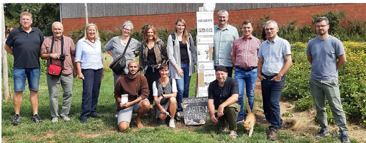
Exkursionsteilnehmer und Gastgeber im Göttinger Land