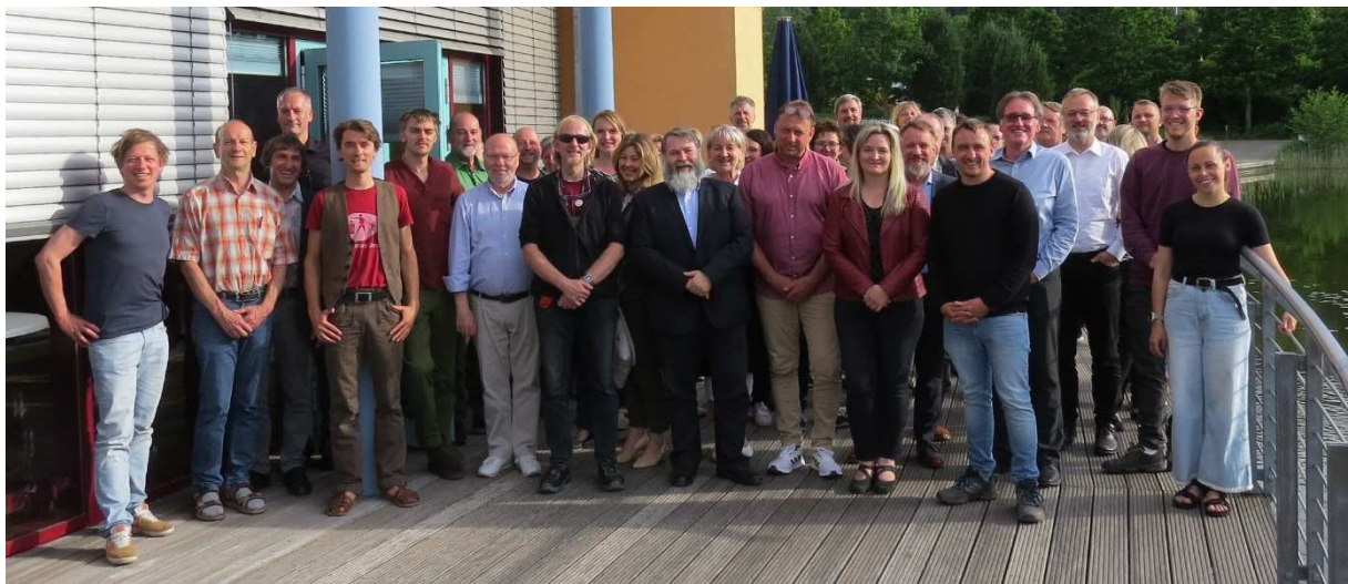
Teilnehmer:innen der Auftaktveranstaltung in der Landessportschule am 23.05.2022

Die neue RES nimmt Gestalt und Form an. Nach der Auftaktveranstaltung am 23. Mai 2022 in der Landessportschule wurde in zwei Werkstatttrunden im Allianzhaus Bad Blankenburg an der Definition der künftigen Handlungsfelder gearbeitet.